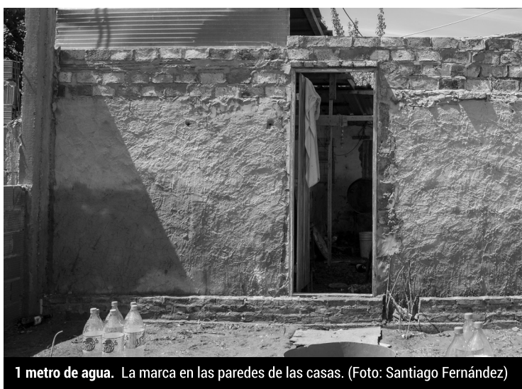
1 metro de agua. La marca en las paredes de las casas.

En tanto la gobernadora María Eugenia Vidal señaló durante una entrevista televisiva que La Matanza recibió $11.800 millones para obras hidráulicas, pero reconoció que "se necesitan u$s 400 millones para que no se inunde más". ■