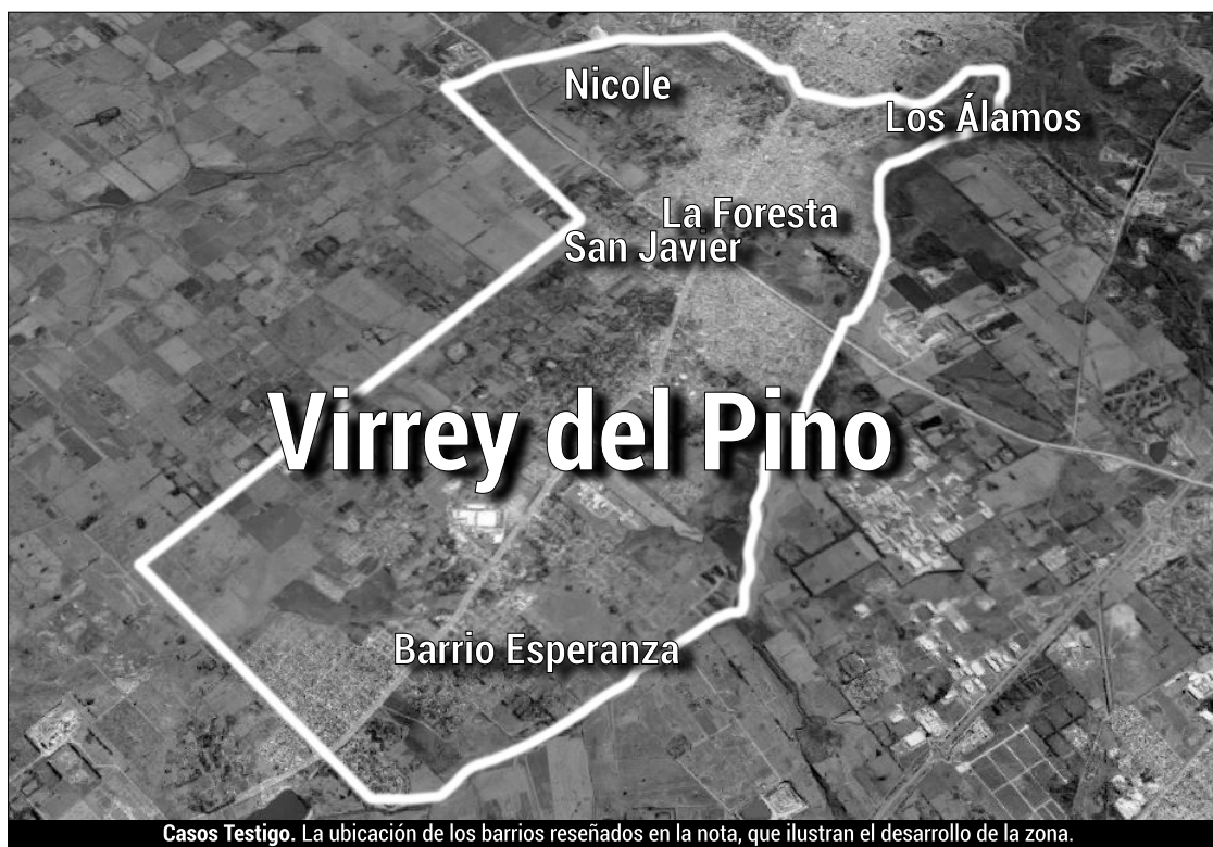
Casos Testigo. La ubicación de los barrios reseñados en la nota, que ilustran el desarrollo de la zona.

En los barrios inundados vive fundamentalmente gente vulnerable, que ocupó el lugar que encontró para