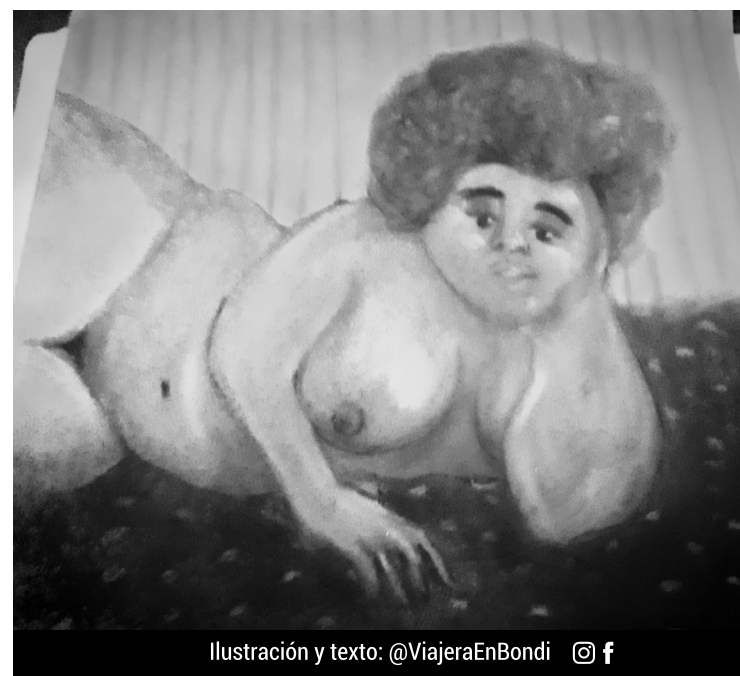
Ilustración y texto: @ViajeraEnBondi

Me acompañaron en el proceso que me trajo hasta aquí, a este medio donde hoy me permite decirles que las tormentas que pasan por nuestra vida no son el problema, el problema es querer que no nos moje y seguir siendo iguales.■