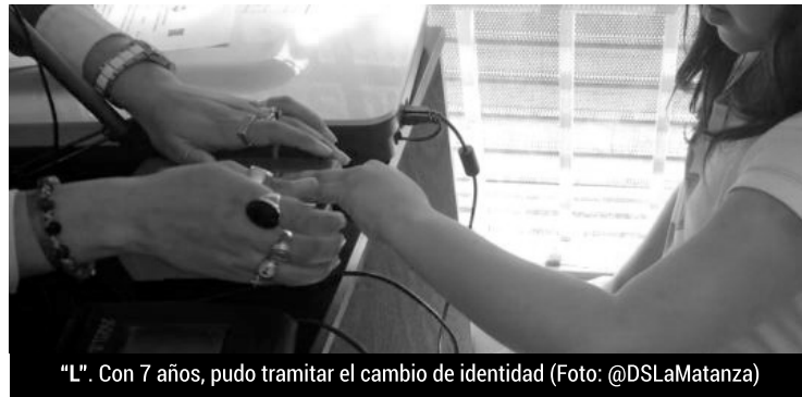
"L". Con 7 años, pudo tramitar el cambio de identidad

Lo realizó a través del dispositivo de diversidad "Somos Todos" que comenzó a funcionar a fines de 2018.