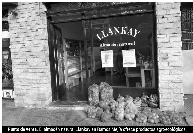
Punto de venta. El almacén natural Llinkay en Ramos Mejía ofrece productos agroecológicos.

Dada la no utilización de químicos que alteren la producción, las frutas y verduras que vende la organización son de estación y se venden a través de bolsos que se entregan los fines de semana. “Los pedidos se