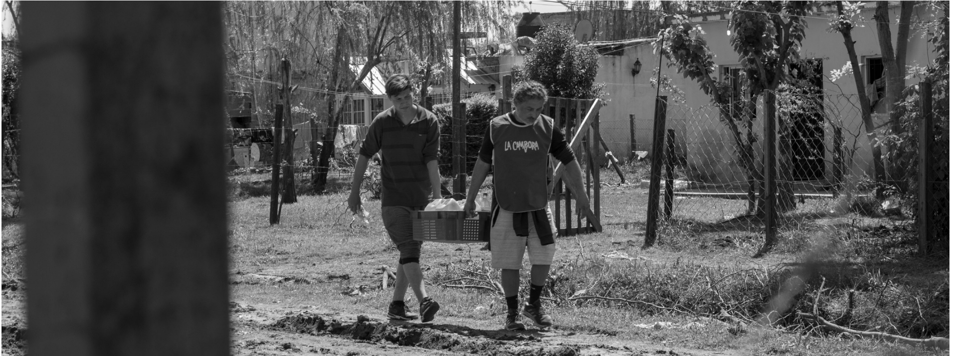
Elementos de limpieza. La principal tarea para garantizar el regreso al hogar es desinfectar las áreas donde llegó el agua.

Las intensas lluvias que inundaron distintas zonas del conurbano bonaerense tuvieron graves consecuencias en Laferrere, González Catán y Virrey del Pino. La actividad de la militancia política de distintos sectores continúa para ayudar en el retorno a los hogares. MD visitó una jornada solidaria en el barrio Esperanza y dialogó con vecinos y militantes.